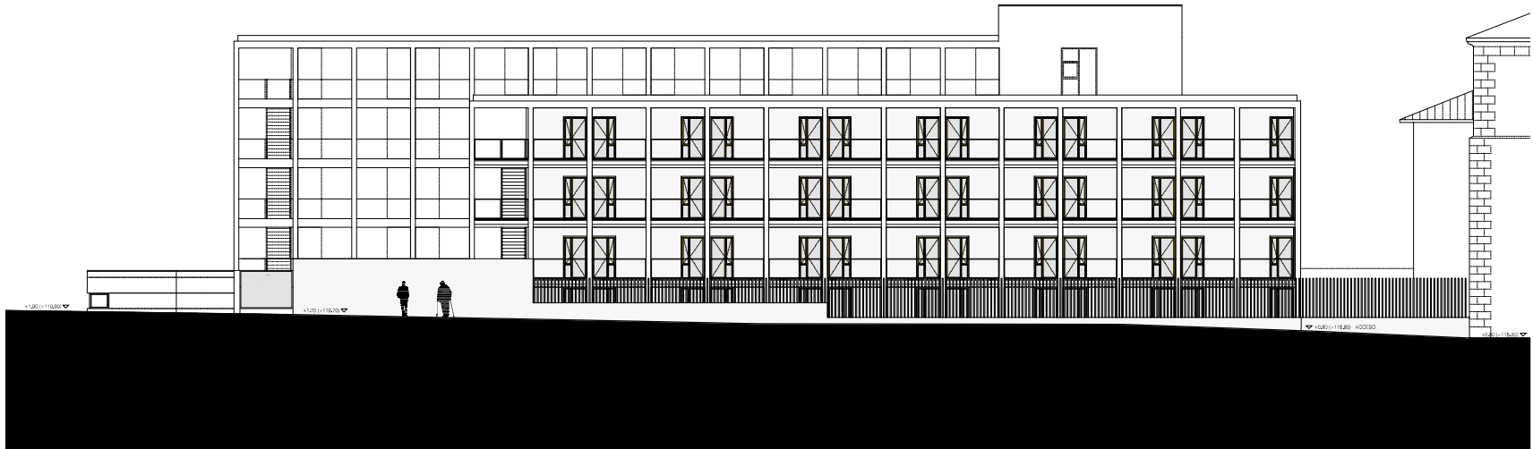
ALZADO C-D (SUR)

CUBIERTA +1.000 PLANTA 4 +10.30 PLANTA 3 +8.00 PLANTA 2 +6.00 PLANTA 1 +3.00 PLANTA B +0.00 (+118.30) +0.00 (+118.00) PLANTA A -0.50 (+111.40)